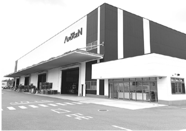
袖ヶ浦機材センターの外観